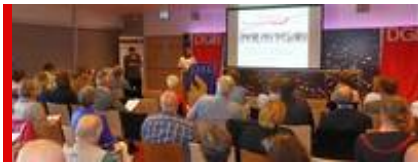
Tagung des Interregionalen Gewerkschaftsrats Rhein-IJssel gegen Langzeitarbeitslosigkeit

Will sich die Gesellschaft mit dem Skandal der dauerhaft verfestigten Arbeitslosigkeit abfinden? Nicht nur in Nordrhein-Westfalen (NRW) ist zu beobachten, dass es für Menschen mit mehrfachen »Vermittlungshemmnissen« kaum noch Chancen gibt, auf dem regulären Arbeitsmarkt Fuß zu fassen (siehe den Beitrag Alarmierender Ausschluss vom Arbeitsmarkt). Damit droht vor allem jungen Menschen ohne abgeschlossene Ausbildung und mit körperlichen und gesundheitlichen Gebrechen auch der Ausschluss vom gesellschaftlichen Leben.